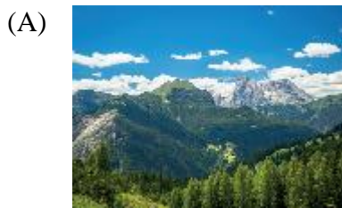
日星隱耀，山岳潛形。