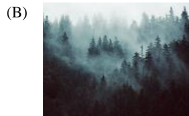
岸芷汀蘭，郁郁青青。