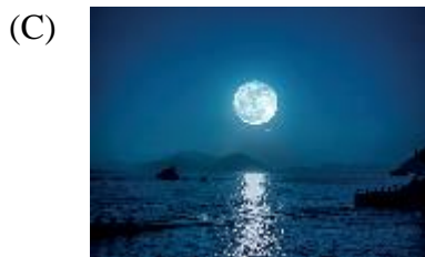
長煙一空，皓月千里。