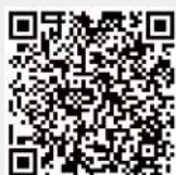
服務學習中心官網