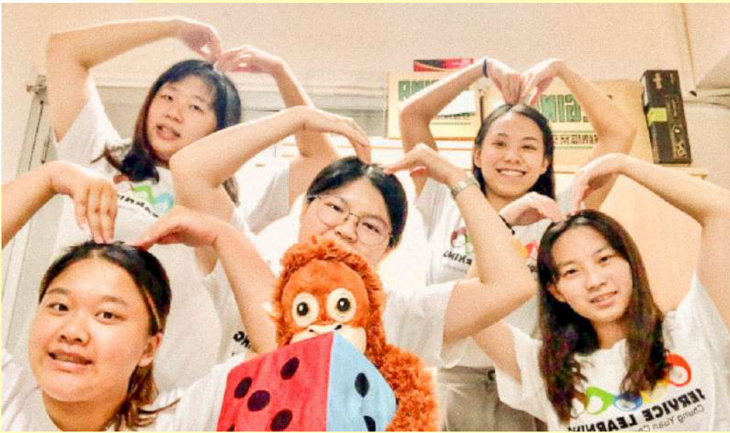
▲ 泰 2 班成員合照