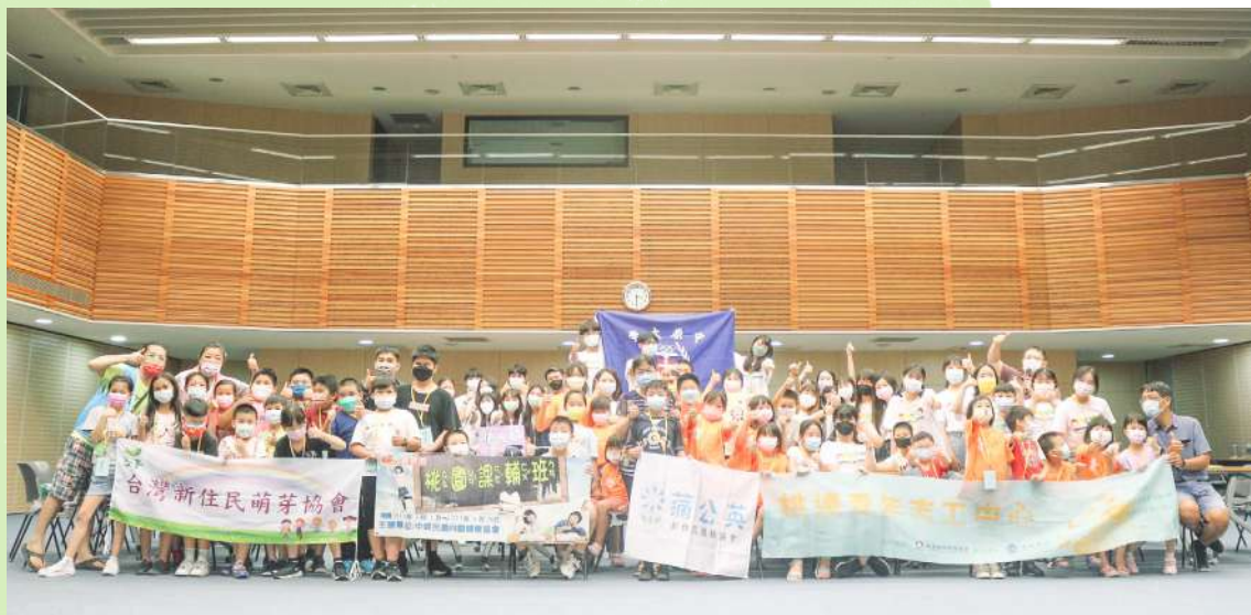
▼ 沒塑啦！種籽團「Fun 新」行動暑期營隊大合照