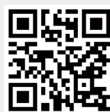
服務學習中心粉絲專頁