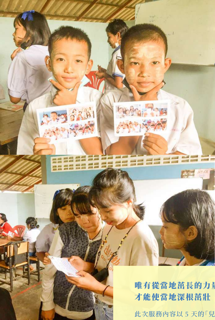
◀ 泰2班團員將營期照片製作成明信片，寫下祝福送到當地