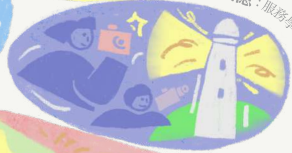
定格馬祖的回憶：服務學習V落客專訪