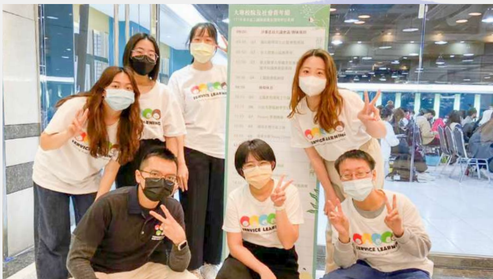
◀ V 落客團隊合影